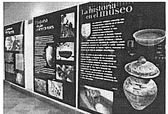
Salón de actos.

constructivo, el mal estado en que se encontraba el edificio de la Alhóndiga sólo ha permitido conservar íntegramente la crujía Oeste, la más estable y la que tiene una mayor presencia urbana por su fachada a la Calle Alhóndiga. La intervención en dicha crujía ha consistido por un lado en eliminar todos aquellos elementos añadidos que perturbaban la concepción y esca-