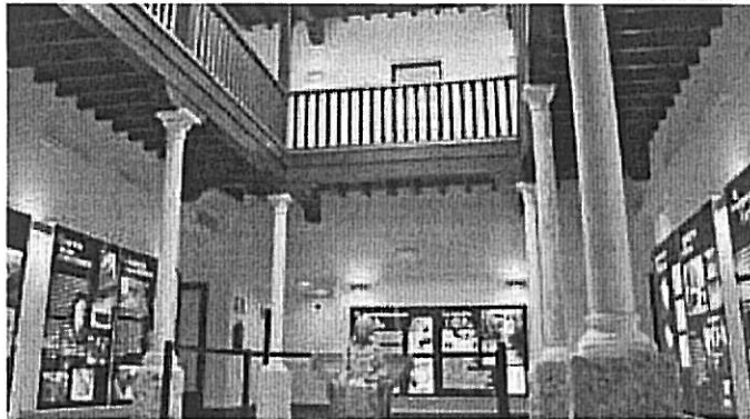
Vista del patio interior, donde se conservan dos columnas originales y donde destaca la restauración de elementos como los artesonados de madera de los techos.